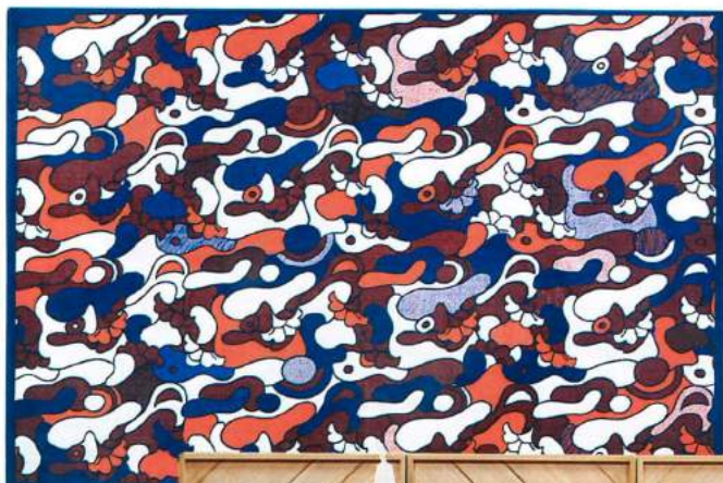
Floriane Jacques Tapis « Gombo », en coton imprimé et brodé, L 220 x l. 150 cm, 259 €, Habitat.

Des formes pures, dont certaines s'inspirent de l'Art déco et du design des années 1950.