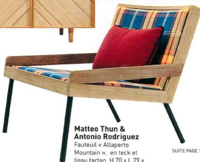
Matteo Thun & Antonio Rodriguez Fauteuil « Allaperto Mountain », en teck et tissu tartan, H 70 x l. 79 x P 80 cm, 710 €, Ethimo.