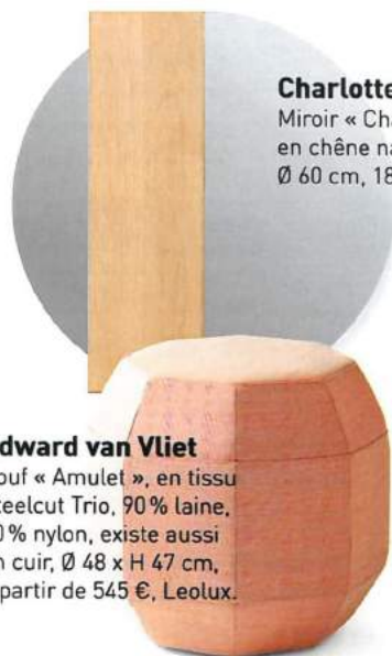
Edward van Vliet Pouf « Amulet », en tissu Steelcut Trio, 90% laine, 10% nylon, existe aussi en cuir, Ø 48 x H 47 cm, à partir de 545 €, Leolux.

Des formes pures, dont certaines s'inspirent de l'Art déco et du design des années 1950.