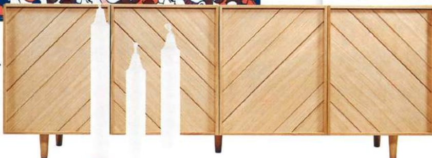
◀ Buffet 4 portes en panneaux de particules plaqués chêne et chêne massif, H 73, 5 x L 200 x P 46,5 cm, 890 €, coll. Madeleine, Habitat.