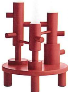
Jaime Hayón Chandelier, en acier laqué, Ø 16 x H 20 cm, 140 €, Republic of Fritz Hansen.