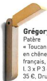
Grégory Jolly Patère « Toucan », en chêne massif français, H 29 x l. 3 x P 3 cm, 35 €, Drugeot Labo chez Fleux.