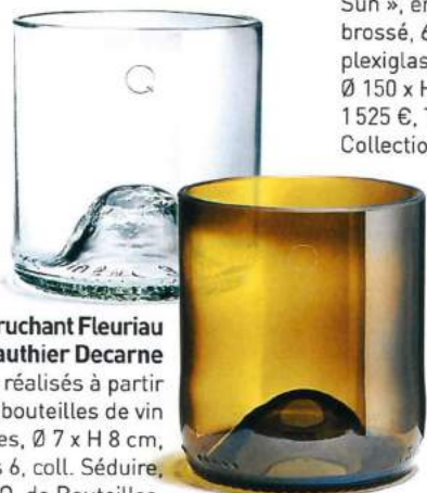
Émeric Cruchant Fleuriau & Gauthier Decarne Verres réalisés à partir de bouteilles de vin recyclées, Ø 7 x H 8 cm, 56,90 € les 6, coll. Séduire, Q. de Bouteilles.